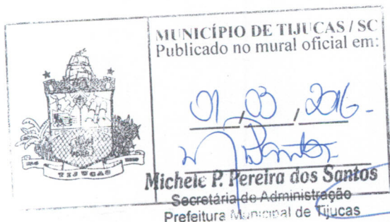
VALÉRIO TOMAZI Prefeito Municipal

Gabinete do Prefeito Municipal de Tijucas, em 1 de março de 2016.